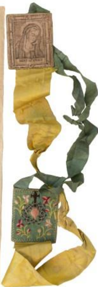
Procès-verbal de réception d'un enfant abandonné et scapulaire qu'il portait lors de son dépôt dans le tour de l'hospice Saint- Gilles, 3 août 1823. AEN, Hospices civils de Namur, n° 356.